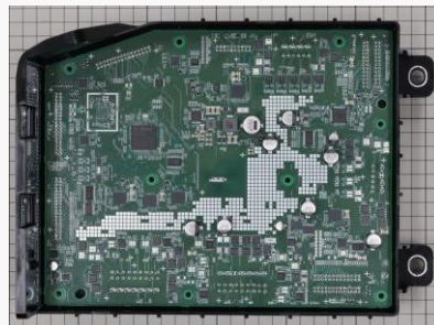
Xiaomi(小米) SU7 Max搭載 統合ECU(BCM RH) 内部