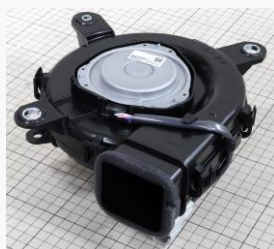
バッテリー冷却ブロワ 外観