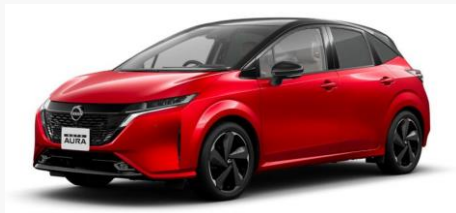
日産 NOTE AURA